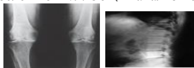
Рентгенограмма коленных суставов

Иммунологический анализ крови: ревматоидный фактор отрицательный, С-реактивный белок - 8 мг/л. Общий анализ мочи без патологии.