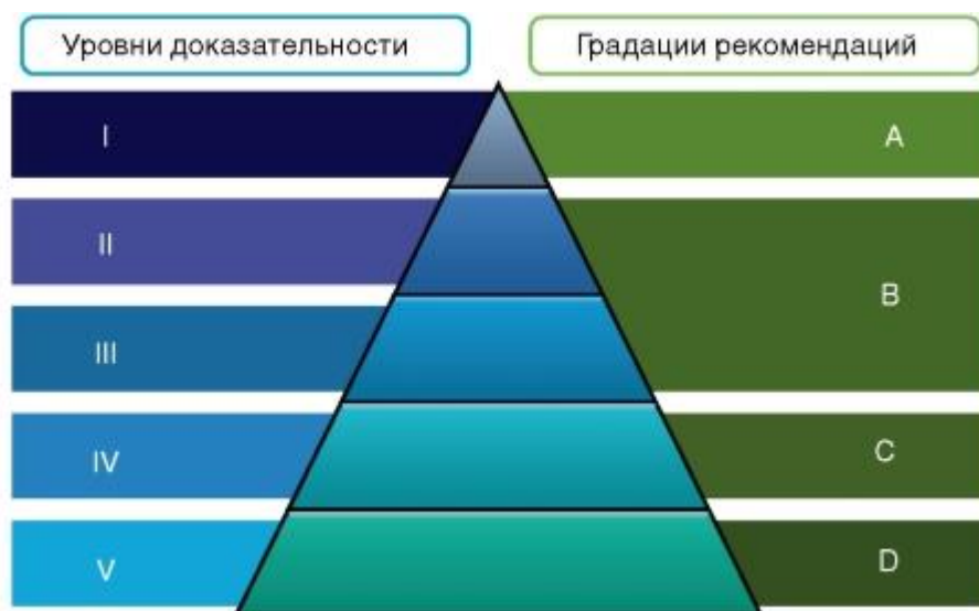
Рисунок 2. Соотношение уровней доказательности и градаций рекомендаций (Oxford Centre for Evidence-Based Medicine).

А на рисунке 2 - соотношение уровней доказательности и градаций рекомендаций.