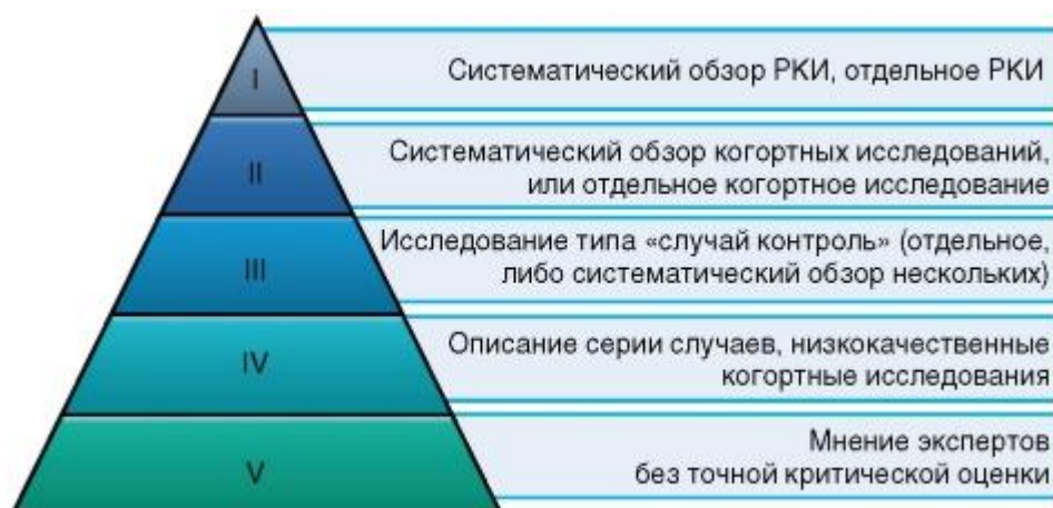
Рисунок 1. Уровни доказательности

Шкала уровней доказательности, разработанная Оксфордским Центром доказательной медицины (Oxford Centre for Evidence-Based Medicine).